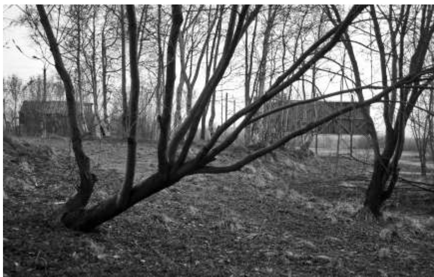
2012 г.