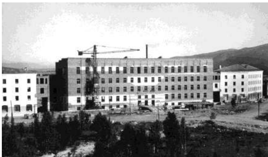
Строительство геологического института. ( Ул. Ферсмана, 14). 1959 г.