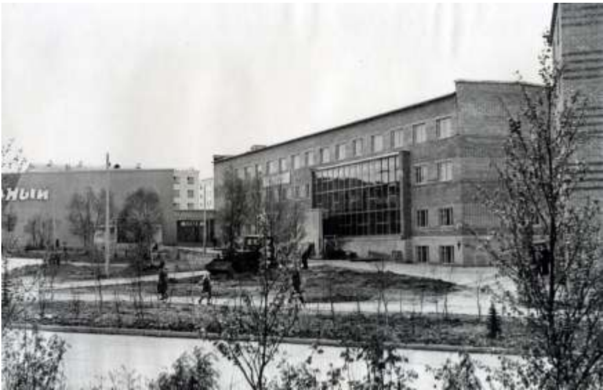
Дом связи (пл. Ленина,4а). 1967 г.