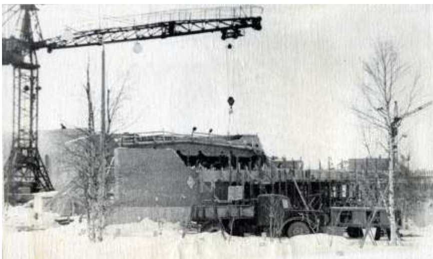
Строительство кинотеатра «Полярный» (пл. Ленина, 3). 1965 г.