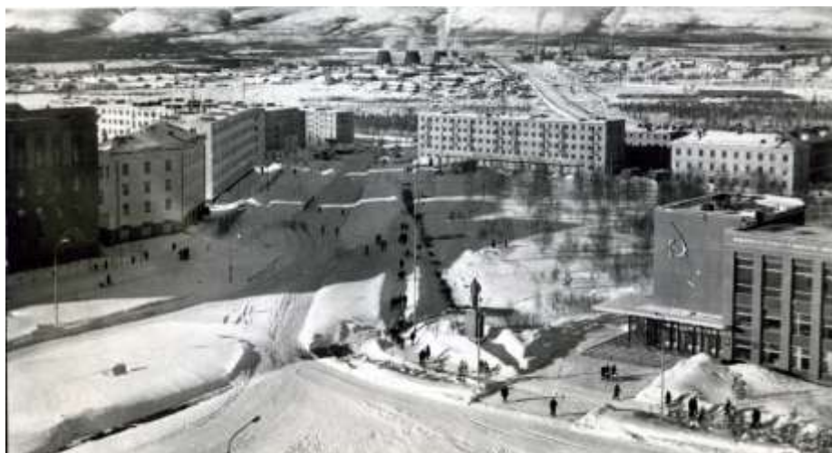
Площадь Ленина и улица Ферсмана.