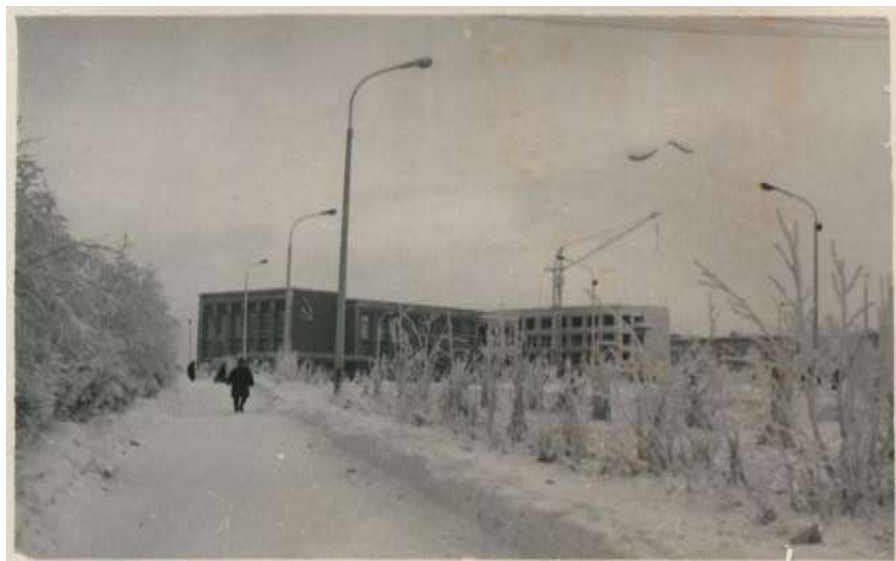
Горком КПСС и строящееся здание горисполкома (пл. Ленина, 1).