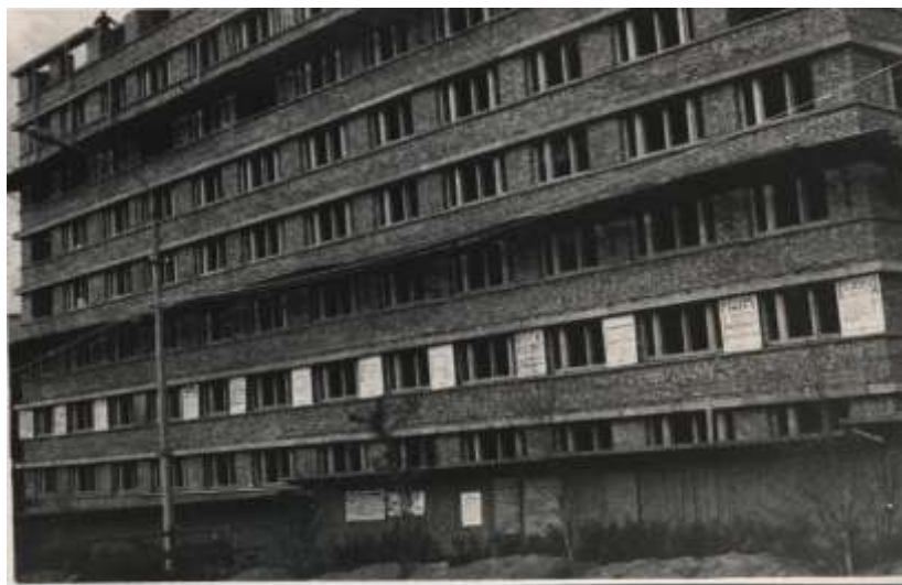
Строительство гостиницы «Аметист» (ул. Ленина, 3). 1970 г.