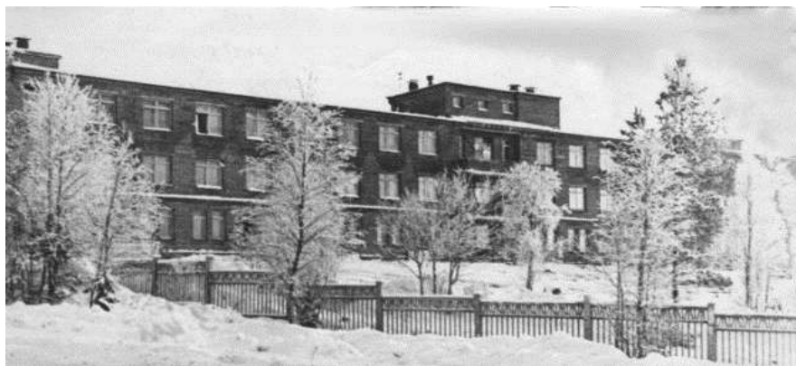
Больница в Новом городе. 1968 г. (Ул. Космонавтов, 3)