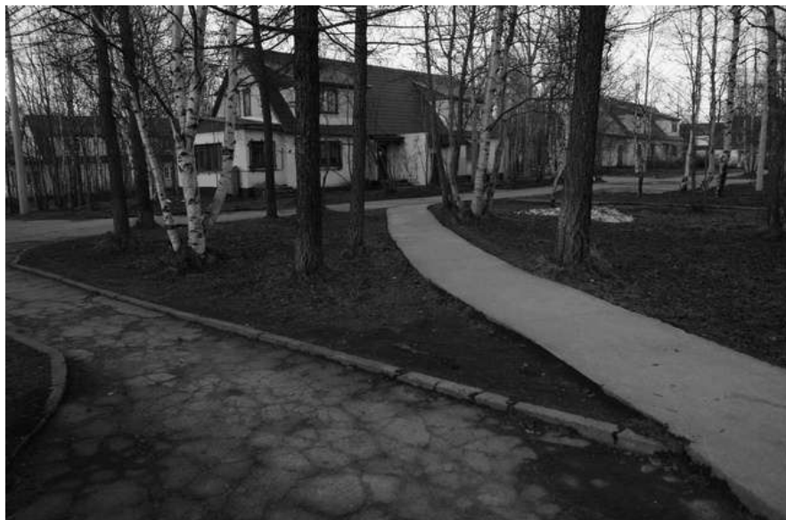
Академгородок. 2012 г.

Дрожит на столе подстаканник, В воде ни дорог нет, ни рельс. Уходит, уходит «Титаник» В последний и первый свой рейс.