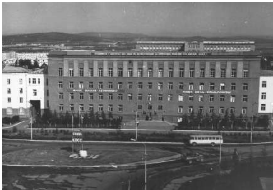
Президиум КНЦ РАН. ( Ул. Ферсмана, 14).