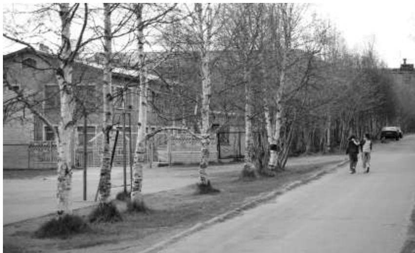
2012 г.

Приятно быть на ветке листиком Вдали от человеческой гадости, И дуракам, и ненавистникам Не доставляя бурной радости, Петь-шелестеть под ветра музыку И зеленеть от солнца лучика, Копить тепло сквозь щёлку узкую Что может быть на свете лучшего?