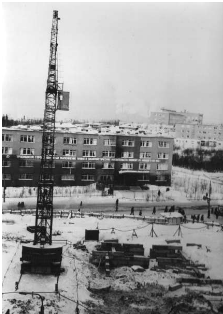
Строительство девятиэтажного дома (пл. Геологов, 1)