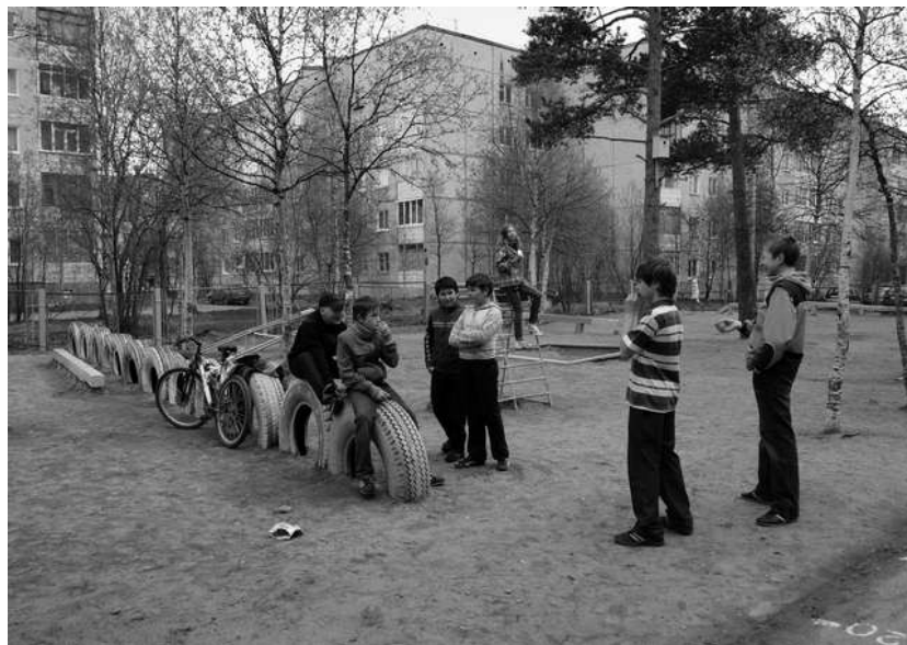
2012 г.