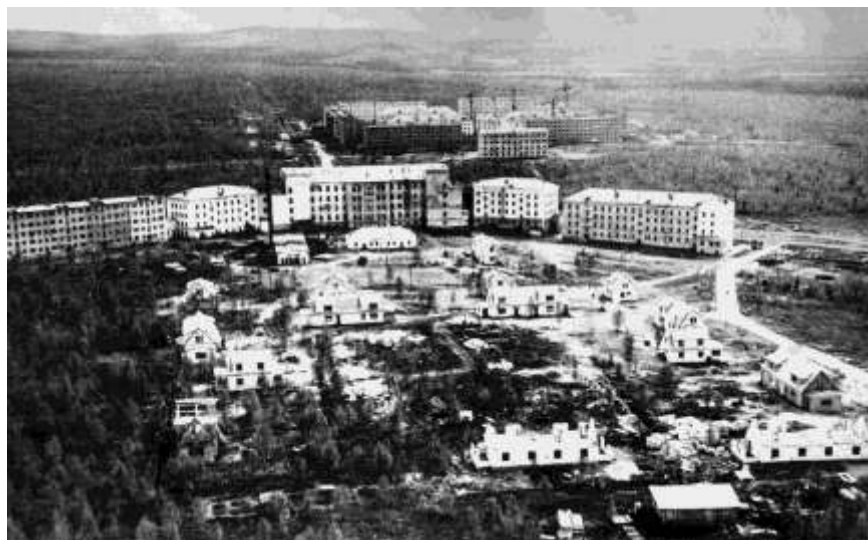
Новый город. 1959 г.