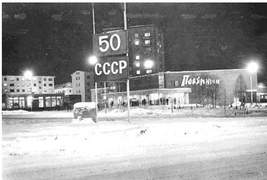
Площадь Ленина. 1972 г. Фото из архива газеты «Дважды два»