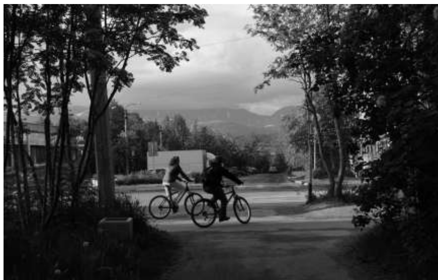
2012 г.