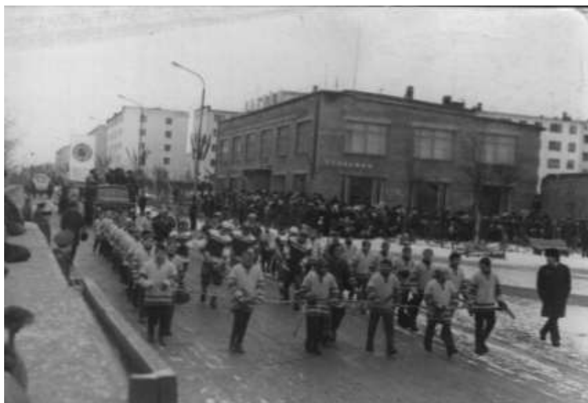
Хоккеисты на демонстрации. 1960-е гг.