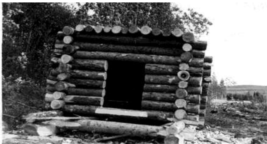
Первое здание-сооружение на АНОФ-2. Фото из архива