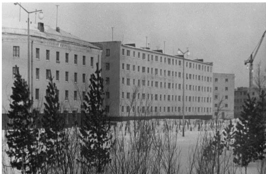
Новый город (Ул. Ферсмана, 12, 10, 8).