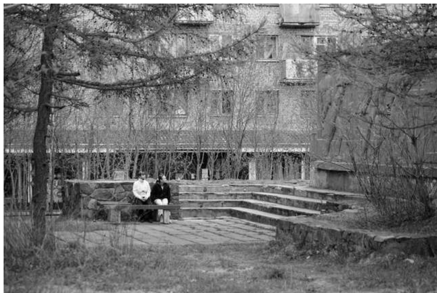
Монумент первым строителям. 2008 г.