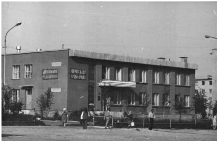
Типография и редакция газеты «Кировский рабочий» (ул. Ленина, 20). 1979 г.