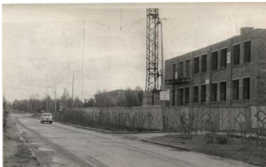
Дом печати (ул. Ленина, 20). 1967 г. Фото из архива