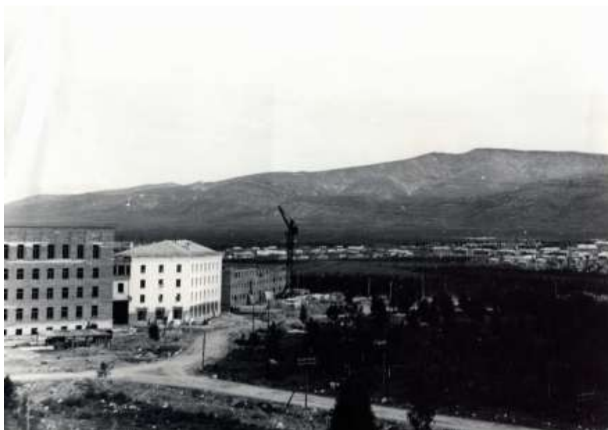
Будущая площадь (Пл. Ленина). Фото из архива