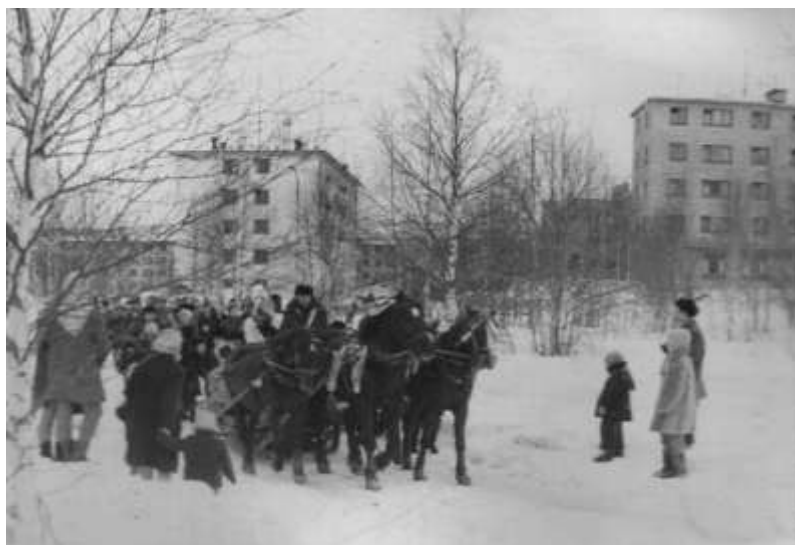
Эх, зимушка зима - зима снежная была! 1972 г.