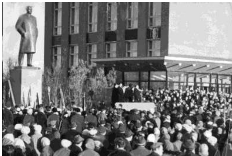
Митинг, посвящённый открытию памятника В. И. Ленину. 3 ноября 1971 г.