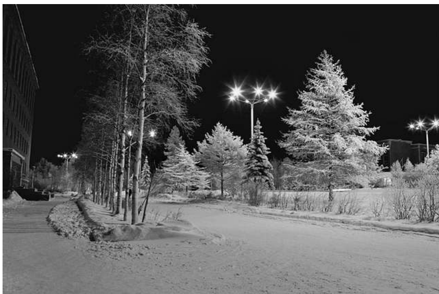
2005 г.

Просто время поменялось, я живу в другой стране, ты – в другой. Но всё же, малость вспоминаешь обо мне.