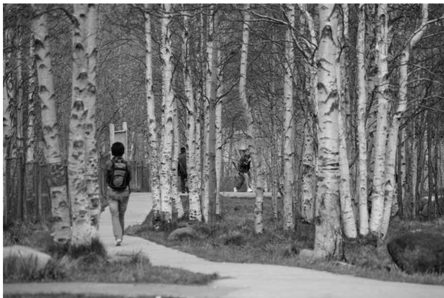
Академгородок. 2008 г.

Я спешу на работу, Вбирая в себя мимоходом Бесконечную гамму Оттенков и полутонов... Здесь слились воедино Человеческий труд и природа. Каждый день для меня Здесь всегда удивительно нов!