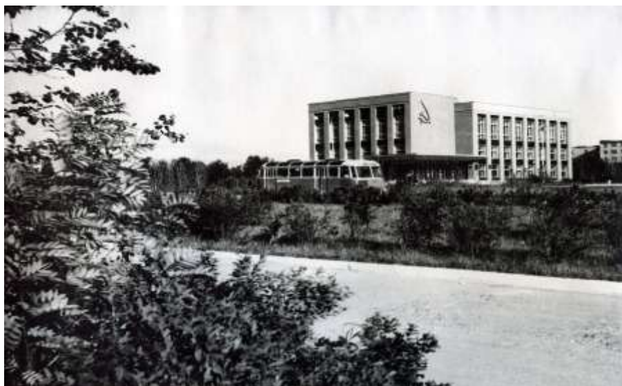
Горком КПСС (пл. Ленина, 1). 1964 г.