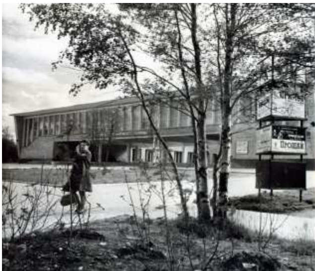
Дворец культуры строителей. 1965 г. (Ул. Ленина, 24).