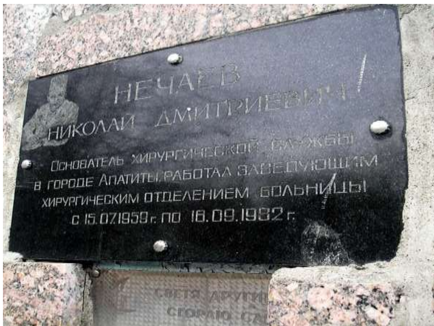
Памятная доска Н. Нечаеву (Ул. Космонавтов, 3)