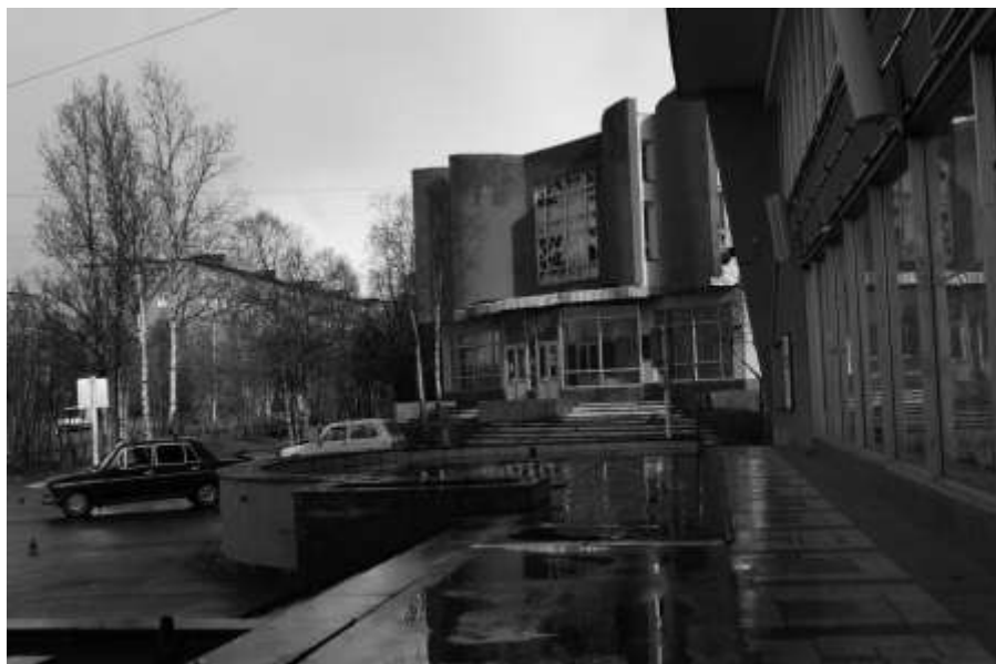
2012 г.

Ты пойми, что ты можешь проститься Не со мной! А с проклятым тем прошлым. А со мною к тебе возвратится Память дней, пролетевших как вечность.