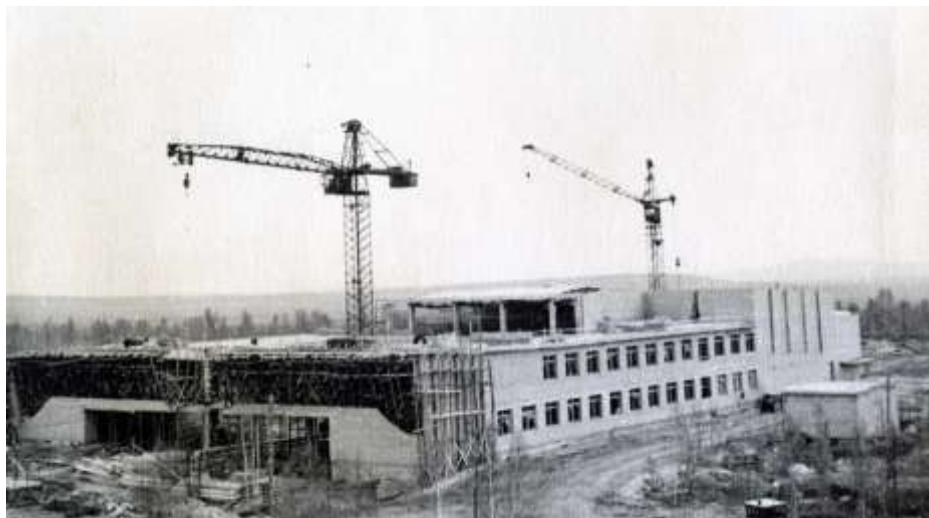
Дворец культуры строителей. 1963 г.

Р.С. Историей литературного объединения «Хибины» до сих пор не занимались. Заметки, написанные к 80-летию газеты «Кировский рабочий», не претендуют на полноту исследования.