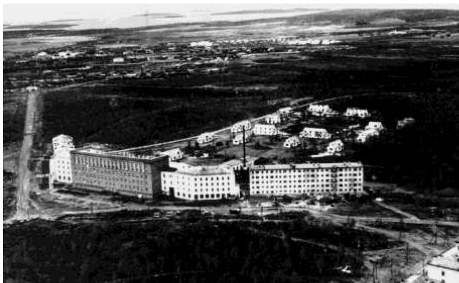
Застройка академгородка.