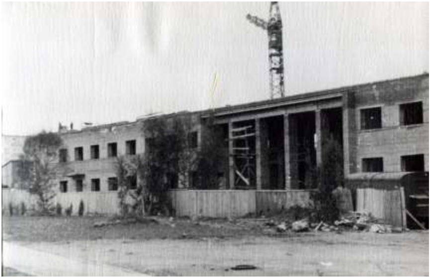
Строительство Дома связи (пл. Ленина, 4а). 1965 г.