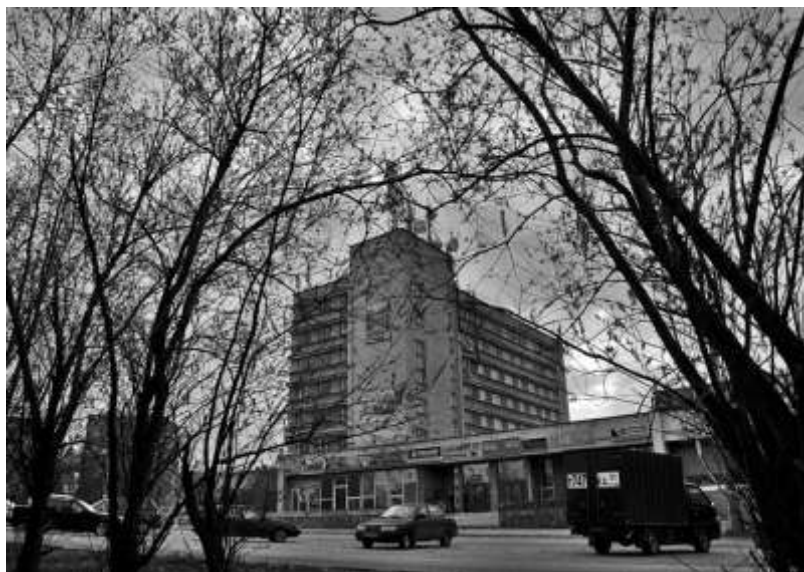
Гостиница «Аметист» (ул. Ленина, 3). 2012 г.