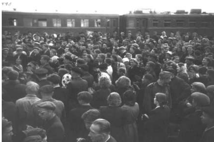
Встреча молодых строителей (станция Апатиты). 1950-е гг.