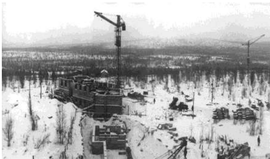
Строительство первых академических домов. (Ул. Ферсмана, 12).