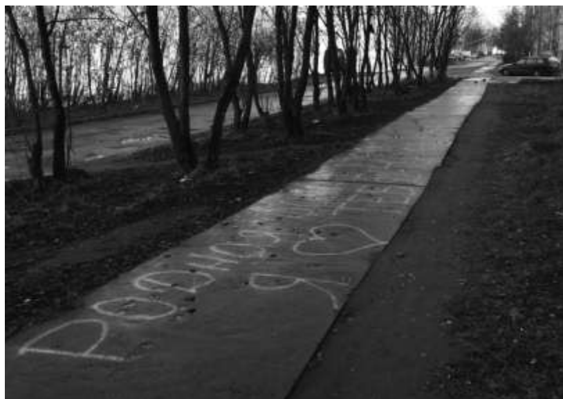
2012 г.