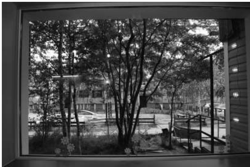
2012 г.

У прохожих или проезжих Будем счастье искать глазами. Получая одни надежды.