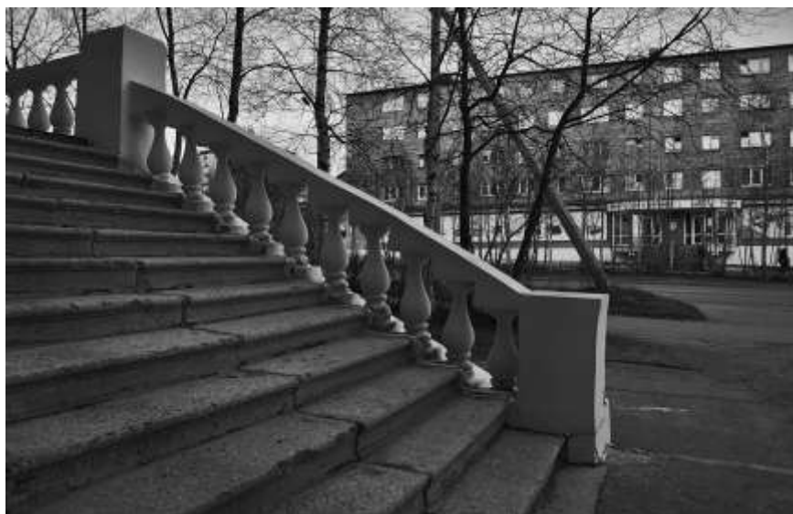
2012 г.