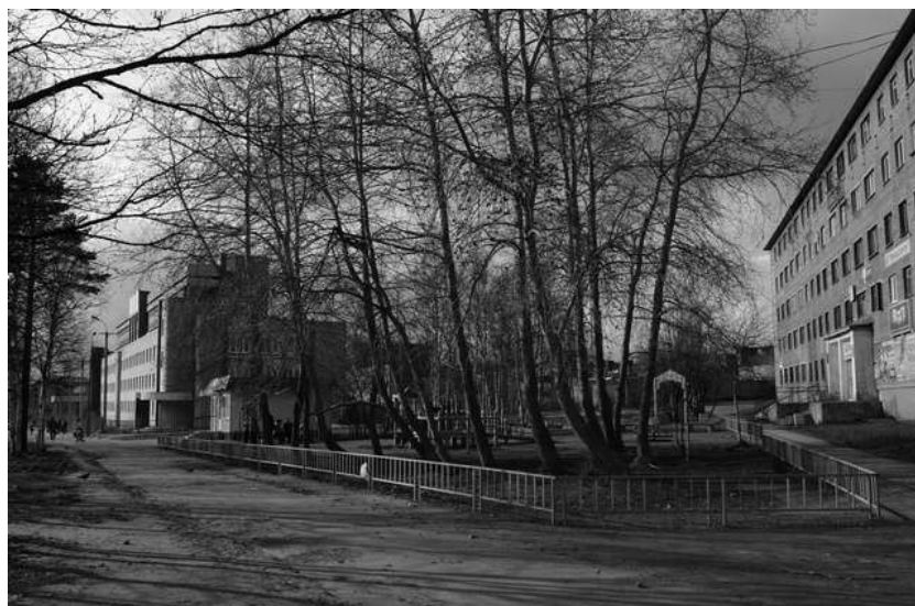
2012 г.