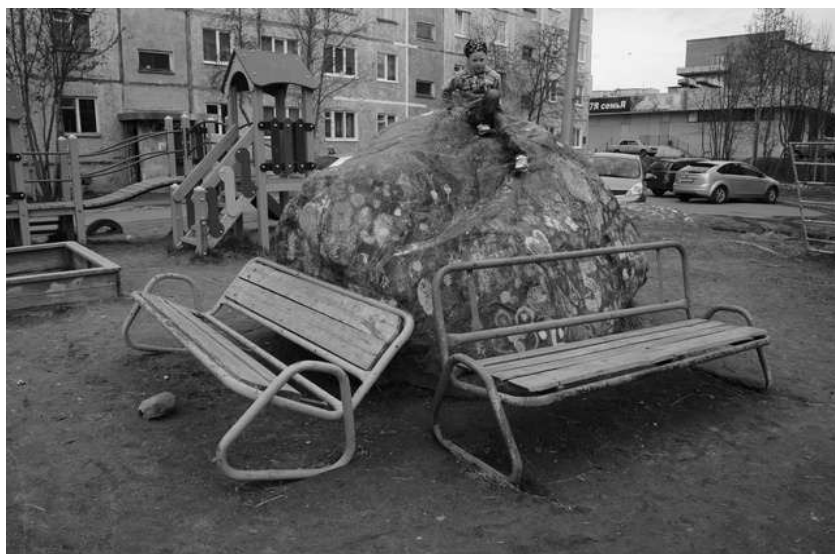
2012 г.