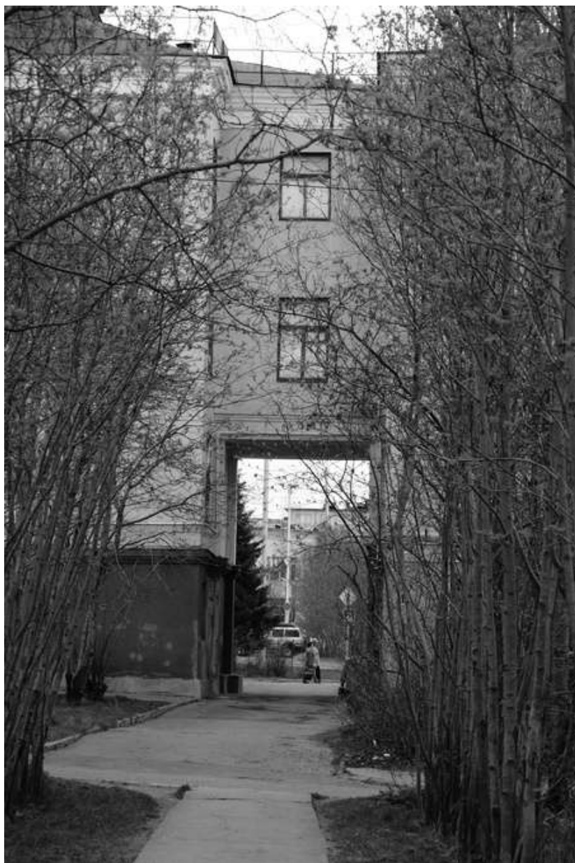
Арка. (Ул. Ферсмана, 14). 2011г.