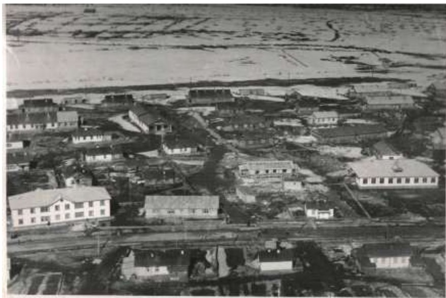
Тик-Губа, пос. Геологов