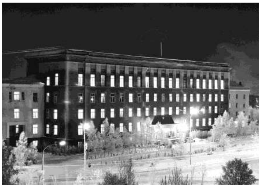
В полярную ночь. (Пл. Ленина).

И веет юга ветерок Сырым, но тёплым духом, И вверх с земли летит парок Почти незримым пухом.