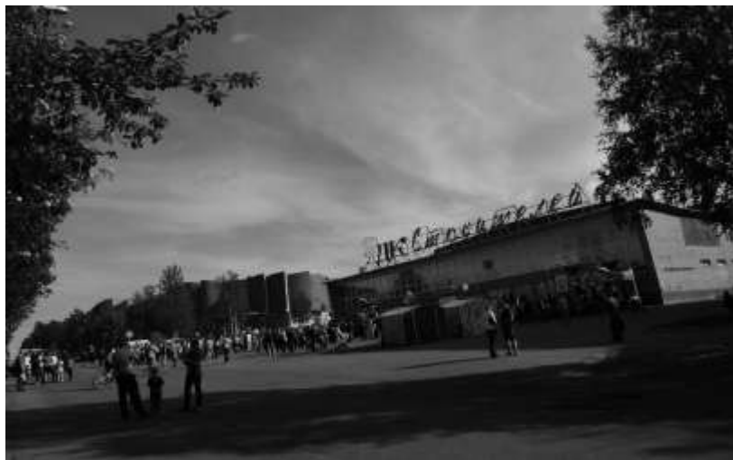
Дворец культуры имени Егорова В. К. (Ул. Ленина, 24) 2012 г.