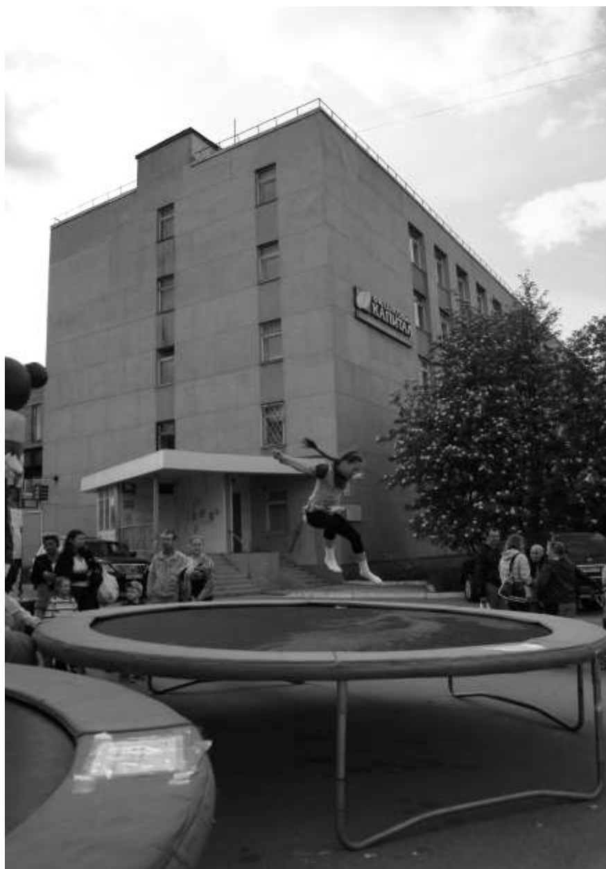
2012 г.